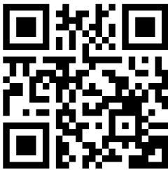
Relatoría sobre los derechos de las personas LGBTI de la Comisión Interamericana de Derechos Humanos.

El año 2019, la Relatoría sobre los derechos de las personas LGBTI de la Comisión Interamericana de Derechos Humanos publicó el documento “ Avances y Desafíos hacia el reconocimiento de los derechos de las personas LGBTI en las Américas ”.